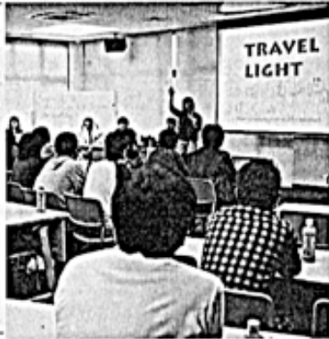
学生は2チームに分かれ、ソフトなどを開発、英語で発表（うるま市）

「必要な英語や中国語を辞書よりも簡単に検索できます」。3期生の学生らは10日、IT企業が集まる沖縄IT津梁パーク（うるま市）で開いた成果発表会で、開発した会話翻訳ソフトなどを英語でPRした。 8人は9月に約1週間、世界的なIT企業が集まるシリコンバレーで研修を受けた。グループなどを訪問し、研究者やプログラマーから直接、話を聞いた。5カ月間の期間中、国内IT各社や独立行政法人、沖縄科学