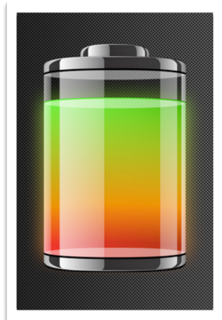
電池 - Battery