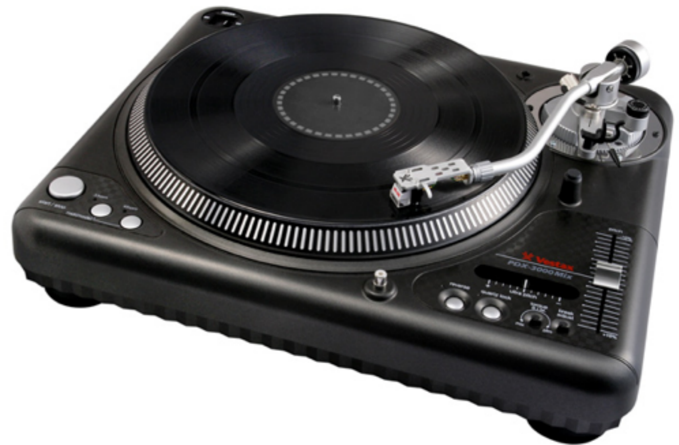
実際の製品の写真